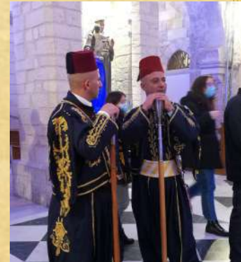
Les gardiens qui précèdent le patriarche

Après avoir passé la nuit dans un monastère, je suis rentrée à Ramallah où j'étais invitée pour le déjeuner du 25 décembre. Dans le bus, j'ai fait la rencontre de deux chrétiens de Gaza, qui avaient obtenu exceptionnellement une autorisation de sortie pour Noël. Ils nous ont parlé de la petite communauté chrétienne de Gaza (environ 1000 personnes) et des conditions de vie dans ce territoire enclavé. Une belle rencontre de Noël !