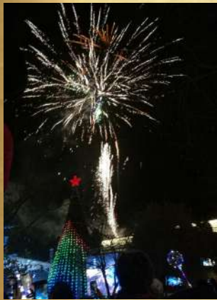
Feu d'artifice de Bethléem sur la place de la Mangeoire

Le mois de décembre a été marqué par la préparation de Noël. Bien que la Palestine soit un pays majoritairement musulman, impossible de passer à côté de cette fête dans le pays où Jésus est né!