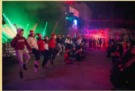
Spectacle de danse à Ramallah

Dans de nombreux villes et villages a eu lieu la cérémonie d'illumination du sapin de Noël. J'ai pu assister aux deux plus importantes d'entre elles, à Bethléem et à Ramallah. Ce fut l'occasion de discours d'importants personnages (premier ministre, maire, autorités religieuses), mais aussi de concerts, danses et de feux d'artifice.