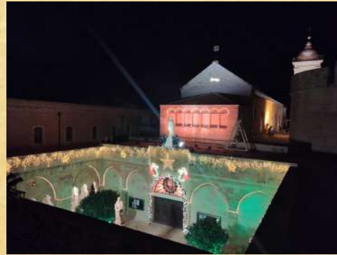
Le cloître de la Nativité vu d'en haut