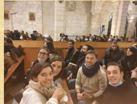
Partie de tarot en attendant la messe de minuit.