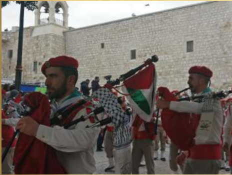
La parade des scouts

J'ai eu la chance d'assister à la messe de minuit dans la basilique de la Nativité, à Bethléém. Lors de la journée du 24 décembre, la ville résonnait de la fanfare des scouts venus de toute la Palestine. Nous avons eu droit à une visite privée de la basilique par un frère franciscain, nous permettant d'accéder à des endroits habituellement fermés au public, comme le réseau de grottes ou le toit de l'église ! La messe de minuit était belle, mais étant aussi un événement politique (présence de la télé, du premier ministre, des consuls...), j'ai trouvé que cela manquait un peu de la joie simple de Noël. Ensuite a eu lieu la procession pour déposer l'enfant Jésus dans la grotte, au lieu supposé de l'emplacement de la mangeoire.